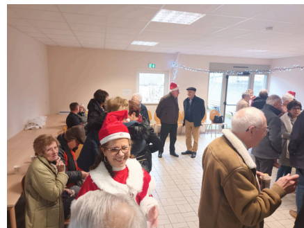
14 décembre - petit déjeuner et distribution des colis de Noël à nos aînés - le CMJ était encore sur le coup !