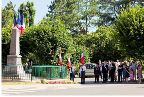
14 juillet - célébration de la fête nationale : après la commémoration devant le monument aux morts, partage du traditionnel pot de l'amitié