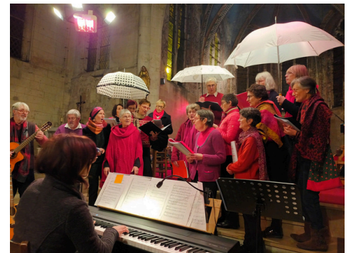
14 décembre - notre église a accueilli une nouvelle fois le groupe vocal CANTO VITAE et un public ravi