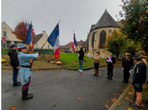
11 novembre - un public nombreux est venu commémorer l'armistice de la première guerre mondiale, dont un jeune poilu porte-drapeau et notre CMJ (sur tous les fronts)