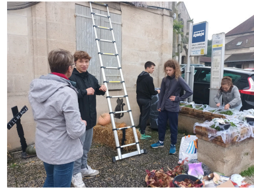
Octobre - le CMJ a recruté la commission fêtes et cérémonies pour décorer le village pour Halloween