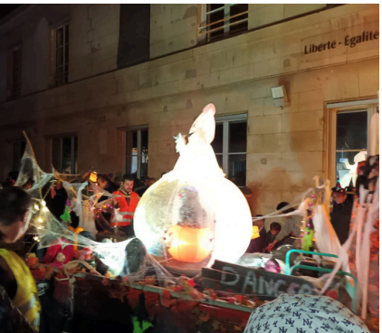
31 octobre - un public toujours nombreux a participé au défilé d'Halloween organisé par le comité des fêtes et se terminant, cette année encore, par un feu d'artifice tiré au niveau de la salle des fêtes