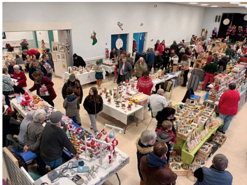
7 décembre - nouvelle édition du marché de Noël, cette fois-ci à l'abri dans la salle des fêtes : fanfare, atelier de la mère Noël, balade en calèche avec le père Noël... Les nombreux visiteurs étaient en entier aussi réchauffés que leur cœur !