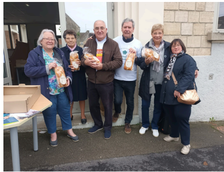
19 octobre - nouvelle opération brioches par le CCAS et pour l'UNAPEI afin de permettre une journée festive pour les usagers de l'organisme accompagnant les personnes en situation de handicap mental