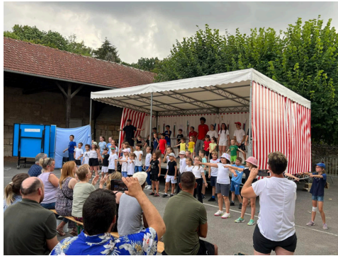
2 août - encore une chouette édition du centre aéré qui se termine ici avec son traditionnel spectacle, cette fois-ci sur le thème des jeux olympiques