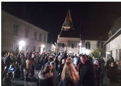
31 octobre : marche d'Halloween dans le village par le Comité des fêtes - les bâtons lumineux ont remplacé les lanternes-bougies