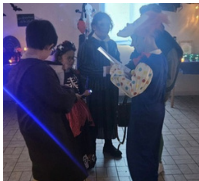
31 octobre : Halloween party par l'association Sauvegarde St-alvatorienne - énigme pour les plus jeunes & conférence nature