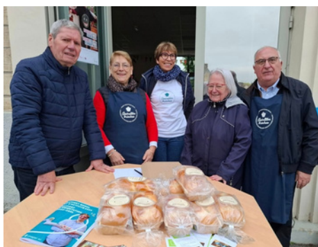
11 octobre : le CCAS mobilisé pour l'opération brioches au bénéfice de la qualité de vie des usagers de l'Unapei de l'Oise