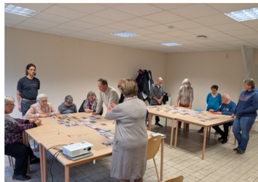
8 novembre : atelier la fresque du climat organisé par l'association Saint-Sauveur à Pleins Poumons (SSAPP)