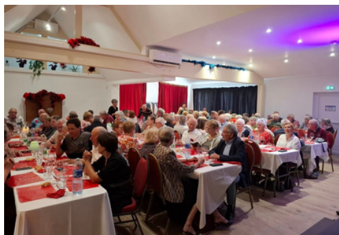
13 septembre : déjeuner spectacle au cabaret du Domaine de la Brèche pour nos aînés organisé par le CCAS