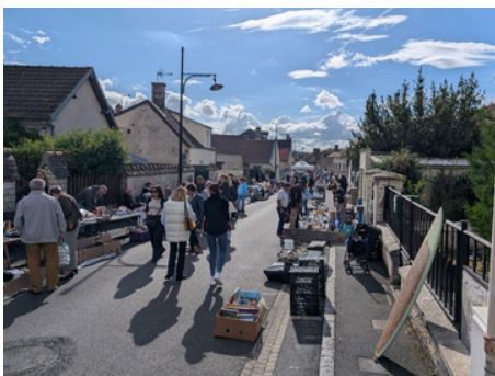
21 septembre : brocante par le Comité des fêtes, forum des associations et journées du patrimoine