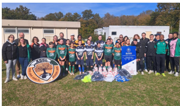
18 octobre : l'ASSL obtient le Label Foot Féminin BRONZE