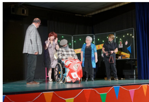
4 et 5 octobre : représentations de la pièce "À vous de gagner !" par le Petit théâtre San Salvatorien