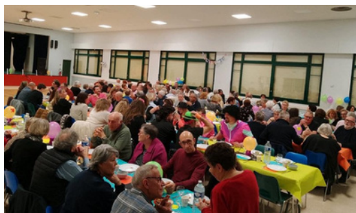
29 novembre : salle comble pour le retour du repas dansant organisé par le Comité des fêtes