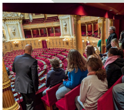
27 octobre : visite du sénat ouverte du CM2 au lycée, organisée avec le CMJ