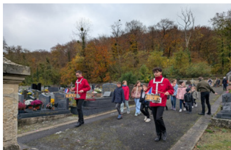
11 novembre : un public nombreux est venu célébré l'armistice de 1918, dont de nombreux enfants qui ont fleuri les tombes des soldats morts pour la France